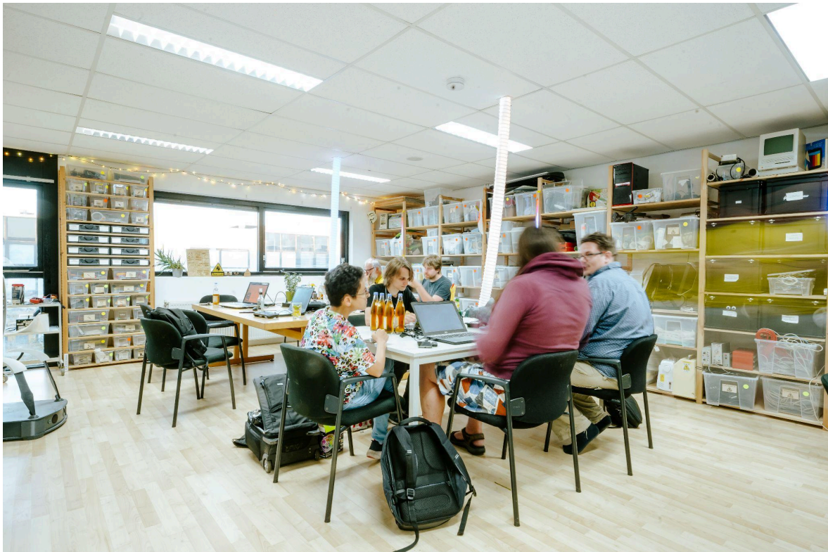
Tkkrlab sociale ruimte

Bij het betrekken van onze nieuwe ruimte hebben we de plek ingericht naar onze eigen wensen. Hiervoor hebben we door het hele gebouw het elektra aangepast en netwerkbekabeling gelegd. In de werkruimte hebben we de vloer geveerd zodat deze ruimte er nu strak uitzien en voor de grote tools extra wandaansluitingen aangelegd. In de presentatie ruimte hebben we beamer met scherm geïnstalleerd.