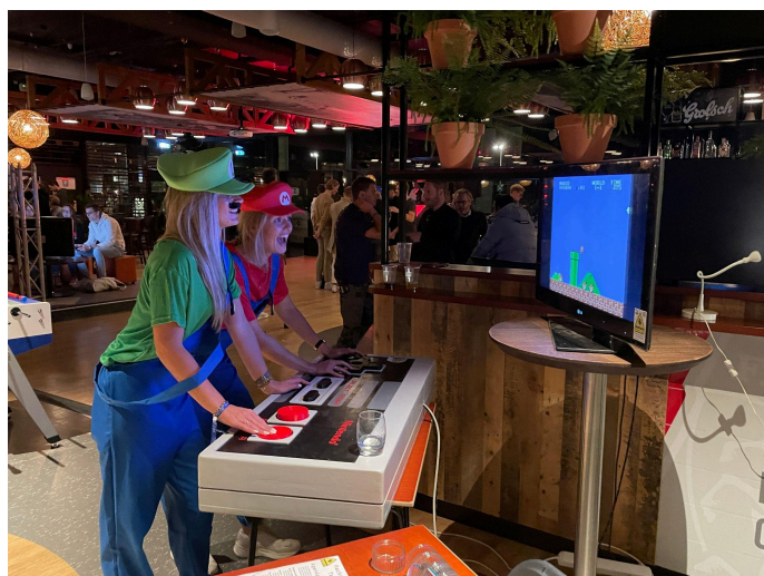
WIRWAR 2022 Enschede

Gaming event voor bedrijven, hier hebben we een eigen stand waar we ons presenteren. Onze Giant NES-controller was erg populair tijdens dit event. We hebben meegedaan in 2021 en 2022. Het plan is om voor de volgende editie in 2024 ook weer mee te doen.