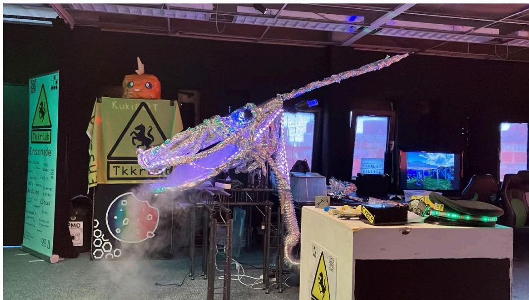
Gogbot 2023 Enschede

De GOGBOT is een evenement dat ons qua thema altijd erg aanspreekt. In het verleden hebben we vaak soldeer workshops gegeven of hadden we een eigen stand op de Gogbot. Voor 2023 organiseerden we een “Open hackerspace” tafel, waar hackerspaces uit heel NL konden aanschuiven.