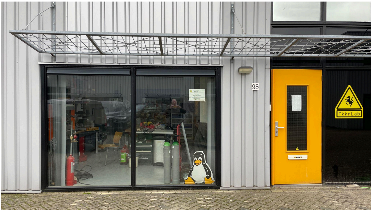
Nieuwe locatie Tkkrlab, Marssteden 98